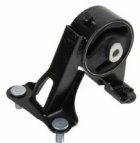
Coxim motor traseiro Rav4 2.4/2.5 2006- 2012 1237128190